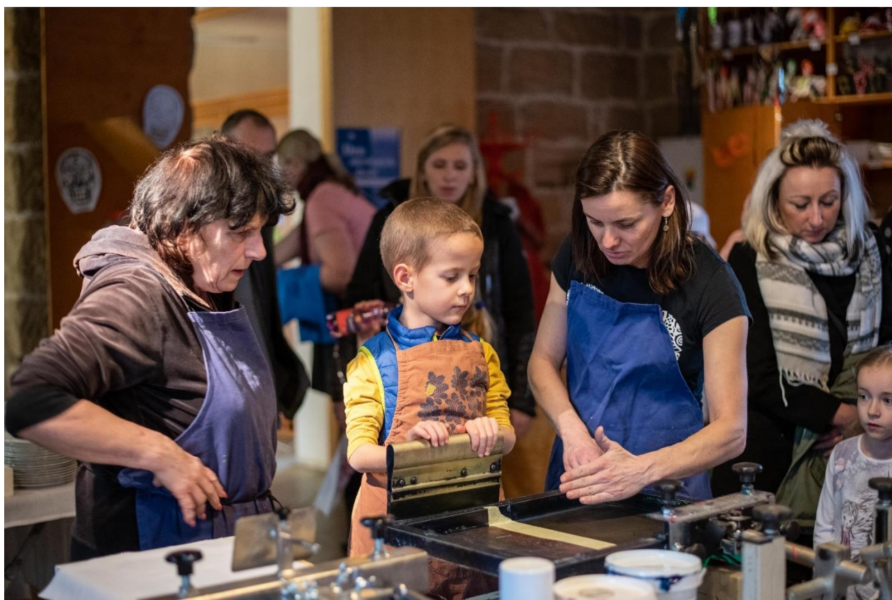
workshop v Centru textilního tisku Česká Lípa