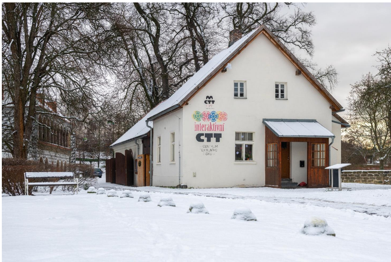
Centrum textilního tisku Česká Lípa