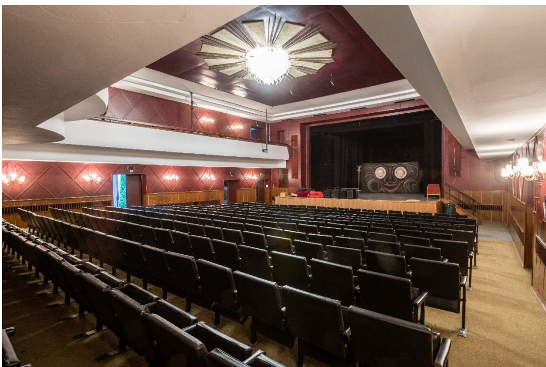
Jiráskovo divadlo Česká Lípa