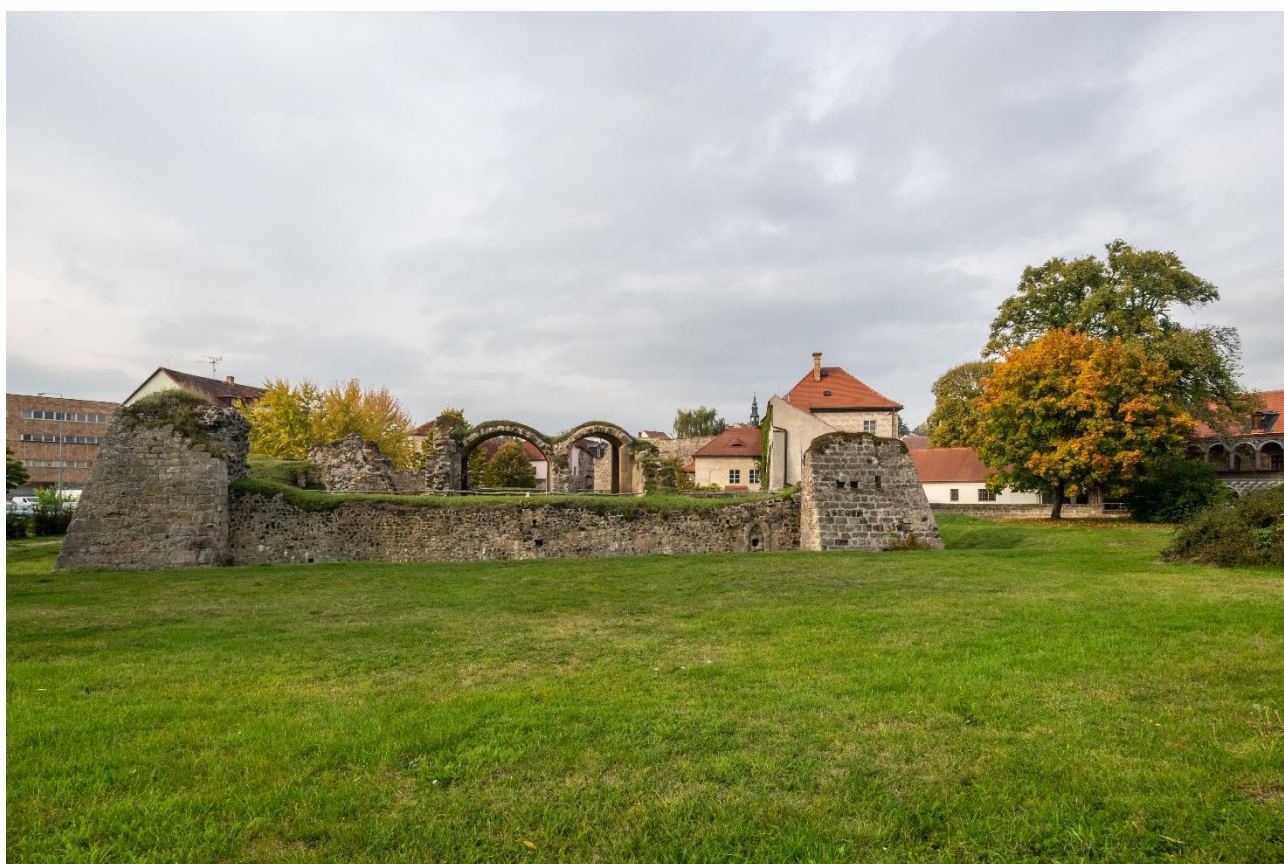
Vodní hrad Lipý